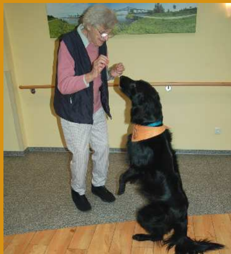
Bewohnerin mit Therapiehund Gimli

Seit 2007 kommen regelmäßig geprüfte Therapie- und Begleithundeteams ins Haus. Es ist erwiesen, dass der Umgang mit Tieren das körperliche und seelische Wohlbefinden von Menschen positiv beeinflusst. Die Bewohner streicheln die Hunde, gehen mit ihnen spazieren, spielen oder sprechen mit ihnen. Dabei stehen Freude und Spaß im Vordergrund. Heilende und therapeutische Effekte sind erwünscht und können natürlich ebenfalls initiiert werden.