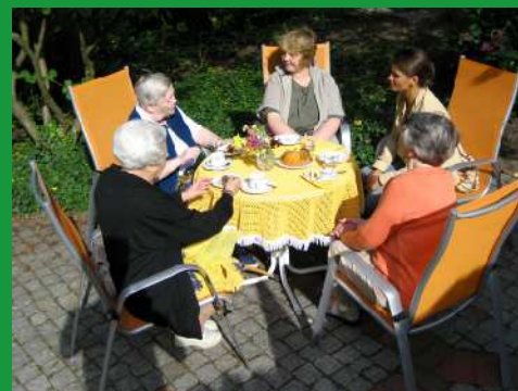
"Kaffee - Kränzchen" im Garten

Draußen essen – auch kein Problem. Das Mittagessen kann im Garten verspeist werden, der Nachmittagskaffee natürlich ebenso. Bleibt nur noch auf schönes Wetter zu hoffen!