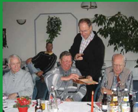
auch das muss mal sein - ein Herrenessen