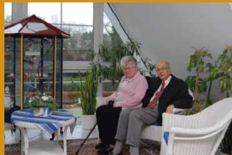
Hier lebt es sich gut.