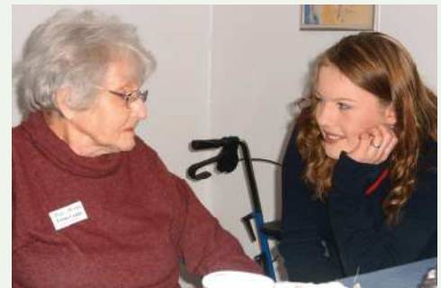
Gespräch mit einer Schülerin von Louisenlund

Unsere Zimmer verfügen alle über einen eigenen Anschluss für Fernsehgerät, Radio und Telefon. Sie können Ihren eigenen Fernseher mitbringen und nutzen. Für einen Internetanschluss sprechen Sie uns an. In den Räumlichkeiten für Gäste mit Kurzzeit- und Behindertspflege oder Urlaubsgäste sind bereits Fernsehgeräte vorhanden. Unser Hausmeister steht Ihnen beim Aufbau und Anschluss des Gerätes gerne hilfreich zur Seite. Damit Sie jederzeit auch für Ihre Familie, Freunde und Bekannten erreichbar sind, können Sie in Ihrem Zimmer ein eigenes Telefon anmelden. So können Sie jederzeit mit Ihren Lieben ein Gespräch führen und eine Verabredung planen. Möchten Sie Informationen aus dem Internet nutzen – in unserer Cafeteria und in Kaminzimmer haben wir neben einen Internetanschluss mit Zugang zum weltweiten Netz auch einen großen Fernseher zur Verfügung. Neben unseren kulturellen Angeboten haben wir für Sie eine großzügige Bibliothek eingerichtet. Hier fühlen sich unsere lesenden Senioren wohl. Möchten Sie sich jeden Tag über die aktuellsten Geschehnisse informieren - bei uns erhalten Sie täglich die Tageszeitungen aus unserer Region oder auch aus Ihrer Heimat – bitte informieren Sie uns rechtzeitig, damit Ihre Tageszeitung aktuell zu Ihnen geliefert werden kann.