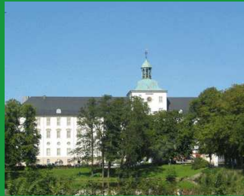
Schloss Gottorf, Schleswig