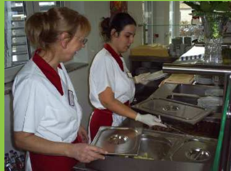
Front Cooking Bereich

Küche, Hauswirtschaft und Wäscherei gehören zum Heim